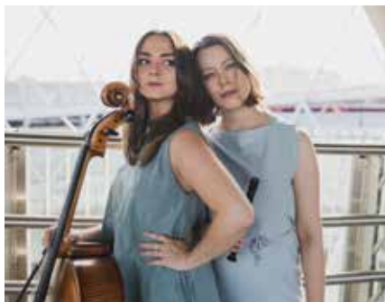
Baubo Collective © Andreas Hoyer