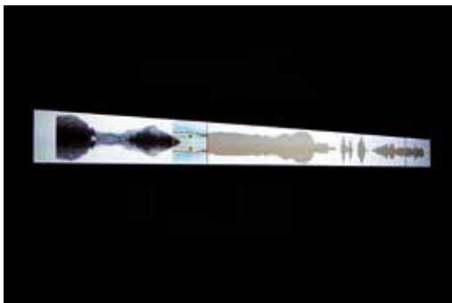
Marko Lipuš, Anthem Reloaded © Marko Lipuš

Marko Lipuš' Videoarbeit Anthem Reloaded zeigt österreichische Hymnenmotive wie Berge, Ströme, Äcker, Dome und Hämmer. Eigene Fotografien der Motive, teils neu interpretiert, kombiniert Lipuš horizontal gespiegelt zu einem Clip. Sašo Kalan gibt dazu das Diagramm der Landschaft in der Spiegelung klanglich wieder.