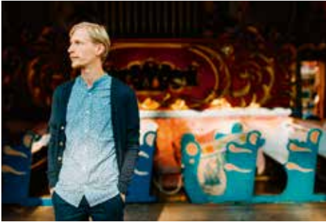
Martin Listabarth

Mit seinem 2022 veröffentlichten Album „Dedicated“ überzeugte er nicht nur die heimische Presse sondern auch internationale Medien wie das britische Pianist Magazine und wurde von Radiosendern wie Ö1 und BR-Klassik einem breiteren Publikum vorgestellt: der Pianist Martin Listabarth. Für die Jahre 2023/24 wurde der Musiker für das Förderprogramm NASOM (The New Austrian Sound of Music) des Österreichischen Außenministeriums ausgewählt, im Dezember gibt er ein Weihnachtskonzert mit klassischen sowie selbst komponierten Werken.