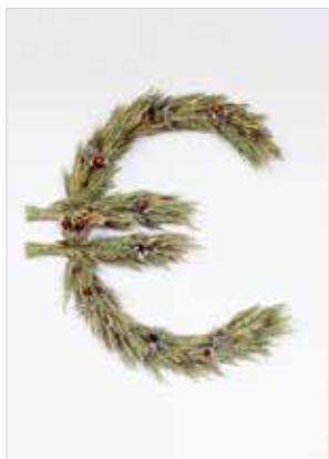
Anna Raczynska, Future Primitive 2021