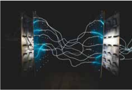
Beispielfoto Energie

Unter dem Titel „Was uns antreibt: Energie und energieia zwischen Politik und Poetik“ wird an der Akademie der Künste vom 22.-24.11.23 die Bedeutung des Energie-Konzepts auf verschiedenen Feldern verhandelt: „Energie, Poetik und Ökologie“, „Energie und Krieg“ sowie „Energie und schöpferische Kraft“. Neben öffentlichen Lesungen, Gesprächen und Vorträgen finden ein Open Space-Format und ein Symposium mit Mitgliedern der AdK und Teilnehmer*innen aus Wissenschaft und Wirtschaft statt. Begleitend werden Videoinstallationen, Dokumentarfilme und kleinere Ausstellungen gezeigt.