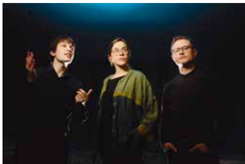
Trio Akk:zent