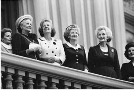
Unterzeichnung des Staatsvertrags, KI generiertes Bild (Stable Diffusion), Claudia Larcher 2022

Seit Mitte 2022 erfährt künstliche Intelligenz (KI) eine zunehmende mediale Aufmerksamkeit. Die Integration von KI in verschiedene Bereiche wie Bildung, Kreativwirtschaft, Bankwesen und Technologie schreitet rasant voran, was jedoch dazu führt, dass die Auswirkungen nicht immer angemessen bewertet werden können. Dies stellt sowohl Regierungen, Unternehmen als auch Einzelpersonen vor die Herausforderung, sich adäquat auf diese Veränderungen vorzubereiten. Die Verbreitung von KI birgt nicht nur Chancen, sondern auch Bedenken hinsichtlich massiver Desinformation, Deep Fakes und technischem Bias, der Vorurteile reproduzieren kann. Die Sorge um den Verlust von Arbeitsplätzen ist ein weiteres globales Problem, das insbesondere „Wissensarbeit“ und Kreativberufe betrifft, obwohl frühere Prognosen sich hauptsächlich auf die Fabrikarbeit konzentrierten. Die steigenden Automatisierungsraten haben vor allem in den Bereichen Architektur, Film, Fotografie, Grafik, Illustration, Literatur und Musik Auswirkungen auf Kreativschaffende. KI-generierte