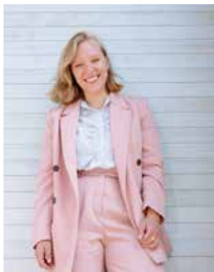
Raphaella Edelbauer © R.E.