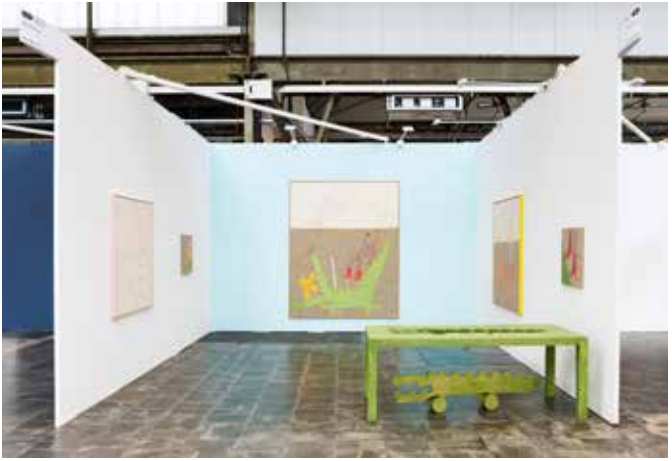
Ausgewählte Werke von Georg Haberler auf der Art Düsseldorf 2024, Weserhalle, Berlin, Foto: Choreo