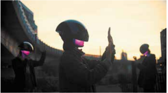
Still aus der Arbeit „ The Intersection “ von Superflux © Superflux