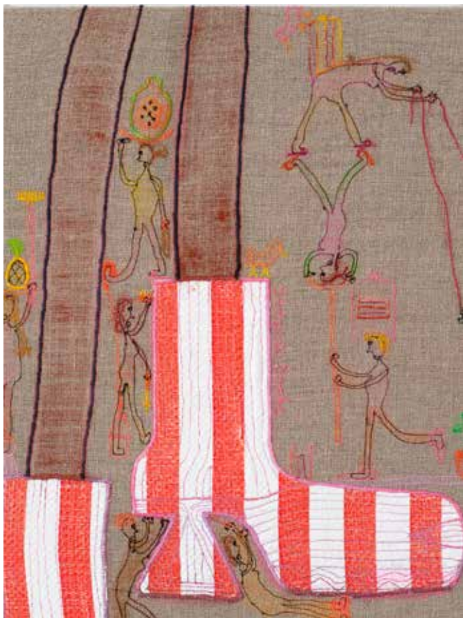
Georg Haberler, Stripped Boots , 2024, © Produktion Pitz