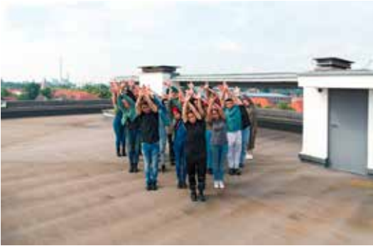
„Prellerhausdach“ aus der Serie „Rhythm is a dancer“, Dessau, 2023

In einer Zeit der multiplen Krisen rückt die Gemeinschaft und das Agieren im öffentlichen Raum in Christina Werners Arbeiten in den Vordergrund. Rhythm is a Dancer entstand am Bauhaus Dessau und wird nun im Rahmen des #EMOP25 (European Month of Photography) im Österreichischen Kulturforum gezeigt. Christina Werner verbindet ihr Interesse an der Arbeiter*innenbewegung mit zeitgenössischen Protestbewegungen. In beidem werden Körper und Gesten als sichtbare politische Zeichen der Zusammengehörigkeit und des Widerstands eingesetzt und Anliegen in den öffentlichen Raum getragen. Zusammen mit Akteur*innen aus Dessau hat Werner historische und aktuelle Posen und Gesten zu einer neuen kollektiven Foto-Film-Performance-Serie weiterentwickelt.